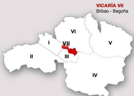
VICARÍA VII Bilbao - Begoña