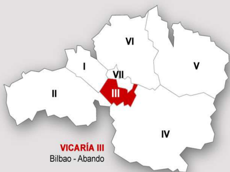
VICARÍA III Bilbao - Abando